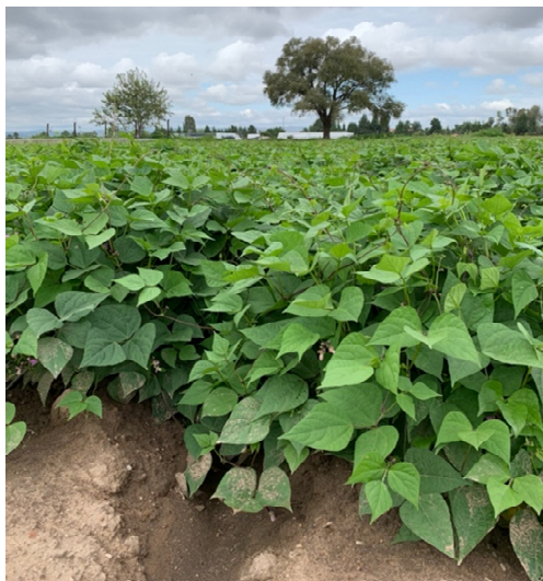
Figura 1. Negro San Luis variedad tardía de frijol usada en siembras de riego y temporal en Durango y Zacatecas.

Fuente Financiera: Recursos Fiscales INIFAP www.inifap.gob.mx