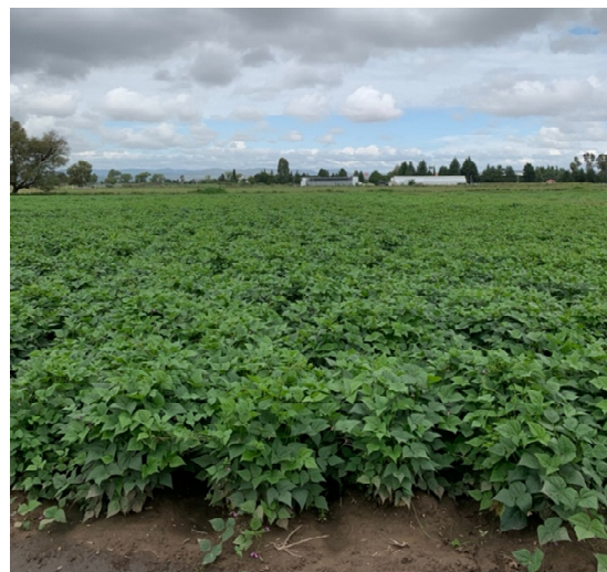
Figura 2. Línea mejorada de frijol NGO14035 que se liberó como NOD 1.