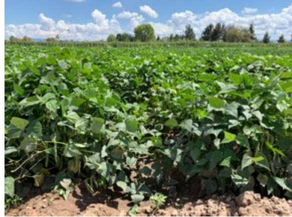
Figura 1. Negro San Luis variedad de frijol popular en siembras de riego y temporal en Durango y Zacatecas.