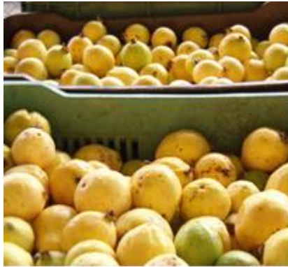
Fruta a granel, desuniforme en formas y grados de madurez